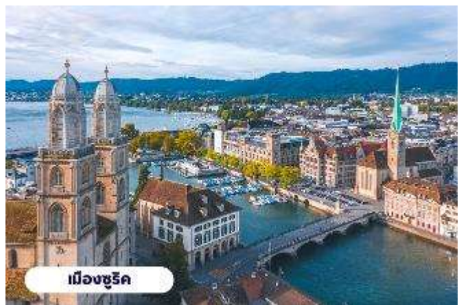
เมืองซูริค

การค้าสัตว์ที่สำคัญของเมืองซูริค ปัจจุบันจัตุรัสนี้ได้กลายเป็น ชุมทางรถรางที่สำคัญของเมือง และยังเป็นศูนย์กลางการค้า ของย่านธุรกิจ ธนาคาร สถาบัน การเงินที่ใหญ่ที่สุดในประเทศ สวิตเซอร์แลนด์ นำท่านแวะ ถ่ายรูปกับ โบสถ์ฟรอมุนสเตอร์ (Fraumunster Abbey) จากบนสะพานมุนสเตอร์