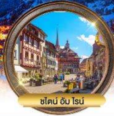
ชิลอน อัม โรน