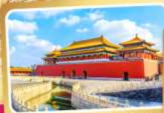
พระราชวังโบราณปักกิ่ง