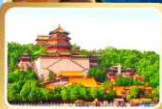
พระราชวังฤดูร้อนอี้เหอหยวน