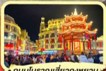
• ถนนโบราณเสียวกงหยวน