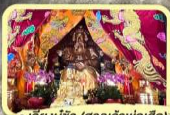
• เอียงบู๊ซิว (ศาลเจ้าพ่อเสือ)