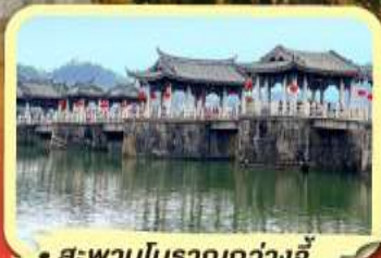
• สะพานโบราณกว้างจี