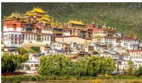
วัดลามะชงจ้านหลิน