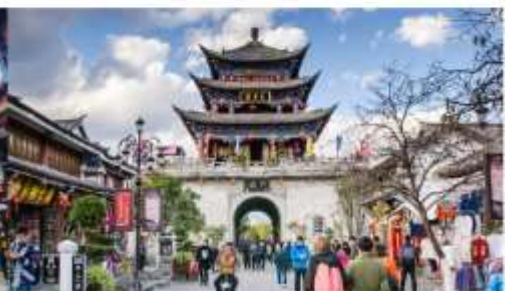
เมืองโบราณต้าหลี่

*ทางบริษัทฯ ขอสงวนสิทธิ์ในการสลับโปรแกรมทัวร์ตามความเหมาะสมขึ้นอยู่กับสถานการณ์หน้างาน โดยคำนึงถึงผลประโยชน์ของลูกค้าเป็นสำคัญ