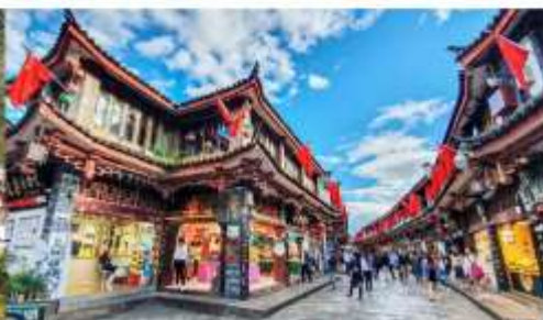
เมืองโบราณลี่เจียง