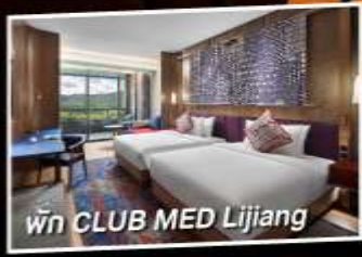
พัก CLUB MED Lijiang