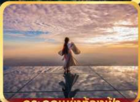
กระเจ๊กแห่งท้องฟ้า