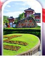
อุทยานหนานซาน