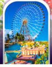
เมืองแฟนตาซี