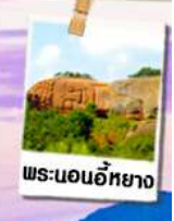
พระนอนอภัย