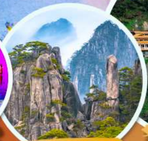
ภูเขาหลวงซาน