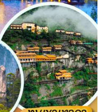
ชมเขาเทวดา

เมนูพิเศษ!! เป็ดปักกิ่ง หมูแดง ปลาหมักเบียร์อึ้งหยาง