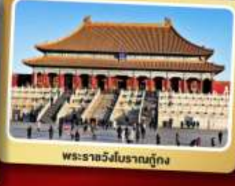
พระราชวังโบราณปักกิ่ง