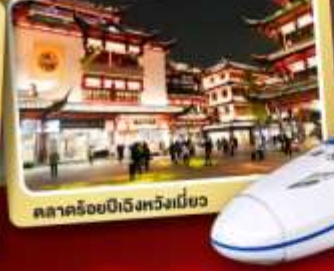
ตลาดร้อยปีเมืองหยิงเป่ย์