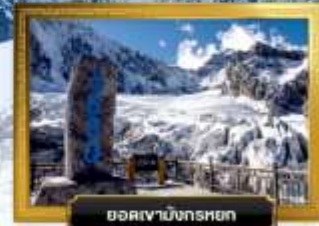
ยอดเขามังกรหยก