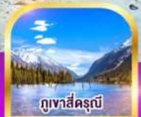
ภูเขาสัตรุณี