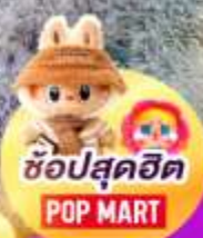
ช้อปสุดฮิต POP MART