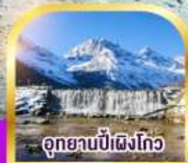
อุทยานบี้เผิงโกว