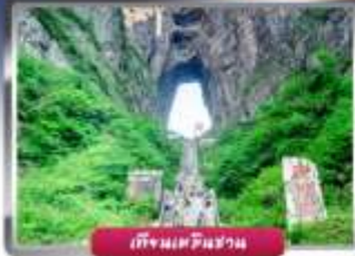
เทียนจินชาน