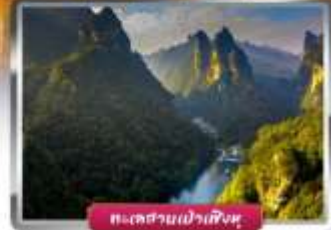
ทะเลสาบเป่าเฟิงหู