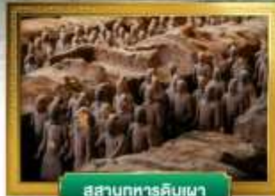
สุสานทหารดินเผา