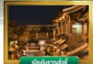
เมืองโบราณลั่วอี้