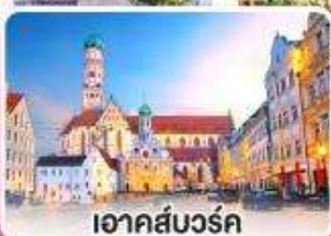
อาคส์บวร์ค