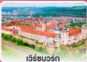
เว็ชบวร์ค