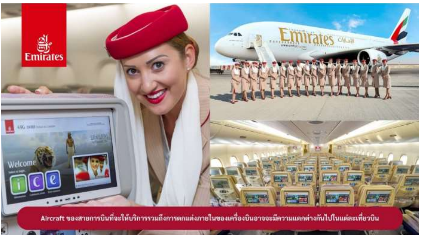
Aircraft ของสายการบินที่จะให้บริการรวมถึงการตกแต่งภายในของเครื่องบินอาจมีความแตกต่างกันไปในแต่ละเที่ยวบิน

21.25 น. ✈ ออกเดินทางสู่ เมืองดูไบ ประเทศสหรัฐอาหรับเอมิเรตส์ โดยสายการบินเอมิเรตส์ เที่ยวบินที่ EK373 (📺) บริการอาหารและเครื่องดื่มบนเครื่องบิน