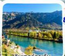
อินเทอร์ลาเก็น