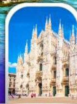
DUOMO MILAN ITALY