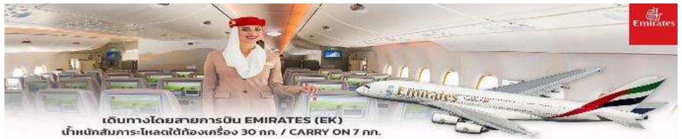
เดินทางโดยสารการบิน EMIRATES (EK) น้ำหนักสัมภาระ-โหลดใต้ท้องเครื่อง 30 กก. / CARRY ON 7 กก.

** การ์ตูน 15 ท่านออกเดินทาง พร้อมหัวหน้าทัวร์คนไทย **