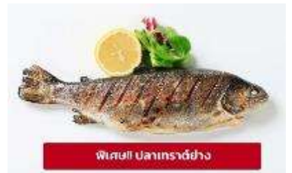
พิเศษ! ปลาเทราต์ย่าง

เกียง 🍴 รับประทานอาหารเกียง (มือที่6) เมนูพิเศษ ปลาเทราต์ย่างท่านละ 1 ตัว นำท่านเดินทางสู่ เมืองมรดกโลกเชสกี คุรมลอฟ (Cesky Krumlov) สาธารณรัฐเช็ก (ระยะทาง 210 กม./ 3.30 ชม.) ล้อมรอบด้วยแม่น้ำ Vltava ทำให้เมืองแห่งนี้มีลักษณะคล้ายหยดน้ำ จนถูกขนานนามว่าเป็น "เมืองหยดน้ำ" จากนั้นนำท่านถ่ายรูปบริเวณรอบนอก ปราสาทคุรมลอฟ (Cesky Krumlov Castle) เป็นปราสาทกอธิคดั้งเดิม ตั้งอยู่ริมฝั่ง