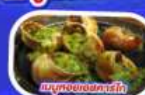
เมนูหอยแมลงภู่อบไวน์ขาว

ทานอาหาร ณภัตตาคารบนหอไอเฟล พร้อมชมวิวแสนโรแมนติก เมนูหอยแมลงภู่อบไวน์ขาว