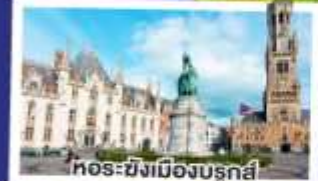
ทอร์ซิงเมืองบรูจส์