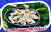
เมนูหอยแมลงภู่อบไวน์ขาว