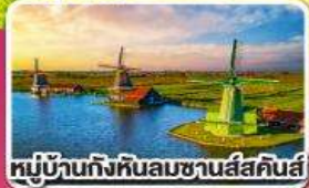
หมู่บ้านกังหันลมชานส์คินส์