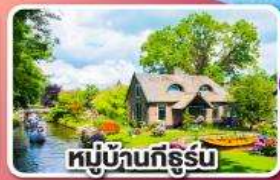
หมู่บ้านทีรูรัม

พักปารีสและอัมสเตอร์ดัม อย่างละ 2 คืน ไม่ต้องเปลี่ยนโรงแรมบ่อย