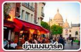
ย่านมงมาร์ต