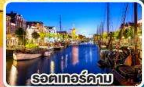
รอดเทอร์ดาบ