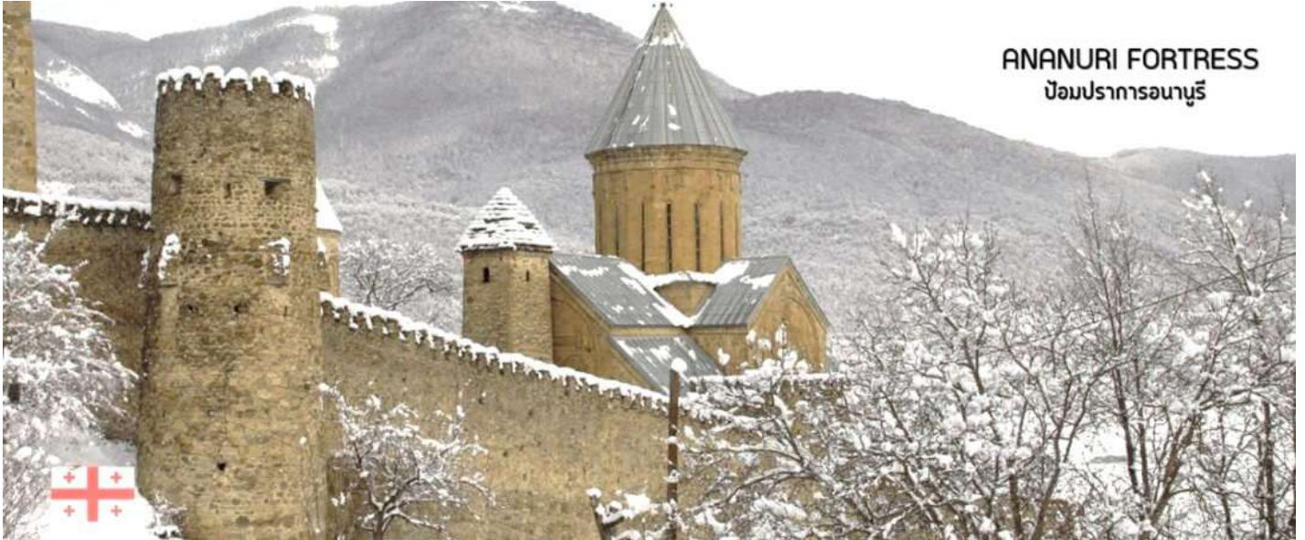
ANANURI FORTRESS ป้อมปราการอนานูรี

นำท่านชม ป้อมอนานูรี (ANANURI FORTRESS) ป้อมปราการเก่าแก่ ที่มีกำแพงล้อมรอบ ตั้งอยู่ริมแม่น้ำอาร์กี สร้างขึ้นในสมัยศตวรรษที่16-17 ภายในยังมีโบสถ์ 2 หลังสร้างอย่างงดงามและยังมีหอคอยทรงสี่เหลี่ยมสูงใหญ่ตั้งตระหง่านอยู่ ทำให้เห็นทัศนียภาพทิวทัศน์อันสวยงามด้านล่างจากมุมสูงของป้อมปราการนี้ (ใช้เวลาเดินทางประมาณ 1.10 ชั่วโมง)