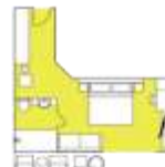
CATEGORY B Balcony Suite (6) app. 32 sqm, incl. Balcony