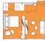
Freydis Suite FS Premium Suite (1) 43 sqm, incl. Balcony