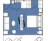
CATEGORY A Junior Suite (4) 40 sqm, incl. Balcony