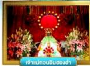
เจ้าแม่กวนอิมฮ่องซ่า