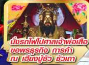
นั่งรถไฟไปศาลเจ้าพ่อเสือ ขอพรธุรกิจ การค้า ณ เชียงบุรีชิว ชิวเกา