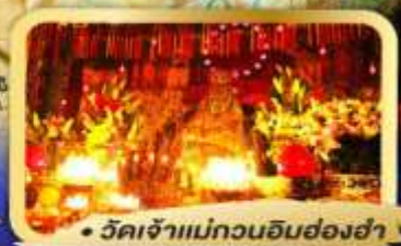
• วัดเจ้าแม่กวนอิมย่องฮา