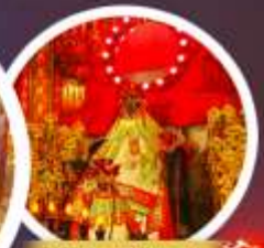
เจ้าแม่กวนอิมสองซ่า