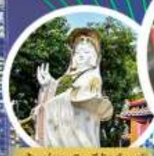
เจ้าแม่กวนอิม รัชส์ เบย์