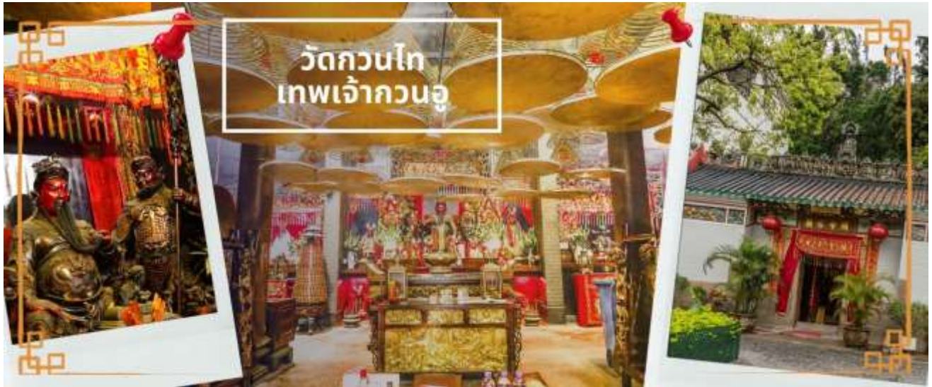
วัดกวนไท เทพเจ้ากวนอู

จากนั้นนำท่านเดินทางไป วัดแขกหมิว หรือ วัดกัณฑ์ (CHE KUNG TEMPLE) วัดแขกสร้างขึ้นเพื่อเป็นอนุสรณ์เพื่อรำลึกถึงตำนานแห่งนักรบราชวงศ์ซ่ง มีนามว่า “แซ กง” แม่ทัพปราบศึก ผู้คนทั่วทุกดินแดนต่างยำเกรงในกำลังพลอันกล้าหาญแข็งแกร่งของแม่ทัพแซกง เป็นวัดเก่าแก่ที่มีความศักดิ์สิทธิ์มาก มีอายุกว่า 300 ปี ตั้งอยู่ในเขต SHATIN มีประวัติเล่าต่อกันมาว่า ขณะที่แม่ทัพปราบศึกอยู่นั้น ทุกแคว้นเขตแดนแผ่นดินใหญ่ต่างก็ยำเกรงต่อกำลังพลที่กล้าหาญในกองทัพของท่าน ยามที่ออกรบเพื่อดำเนินเข้าศึกศัตรูทุกทิศทาง ทุก ๆ ครั้งท่านใช้สัญลักษณ์รูปกัณฑ์ 4 ใบพัดติดไว้ด้านหลังรถศึกนำขบวนในกองทัพ เหล่าทหารกล้ามีความเชื่อว่าเมื่อพกพาสัญลักษณ์รูปกัณฑ์นี้ไป ณ ที่ใด ๆ กัณฑ์นี้จะช่วยเสริมสิริมงคล นำพาแต่ความโชคดี มีอำนาจเข้มแข็ง เสริมกำลังใจให้แก่กองทัพของท่าน ชื่อเสียงในการนำทัพสู้ศึกของท่านจึงเป็นตำนานมาจนทุกวันนี้ ปัจจุบันวัดแขกจึงเป็นสถานที่สักการะเคารพ ขอพร ท่านแซกง โดยมีสัญลักษณ์เป็นกัณฑ์นำโชคนั่นเอง ☯ การหมั้นกัณฑ์นำโชคที่ตั้งอยู่ในวัด เพื่อจะได้หมั้นเวียนชีวิตของเราและครอบครัวให้มีความเจริญก้าวหน้าด้านหน้าที่การงาน โชคลาภ ยศศักดิ์ และถ้าหากคนที่ดวงไม่ดีมีเคราะห์ร้ายก็ถือว่าเป็นการช่วยหมั้นบัดเป่าเอาสิ่งร้ายและไม่ดีออกไปให้หมด ในองค์กัณฑ์นำโชคมี 4 ใบพัด คือพร 4 ประการ ได้แก่ สุขภาพร่างกายแข็งแรง, เดินทางปลอดภัย, สมความปรารถนา และเงินทองไหลมาเทมา ในทุกๆวันที่ 2 ของเดือนแรกตามปฏิทินจีนชาวฮ่องกงและนักธุรกิจจะมาวัดนี้เพื่อถวายกัณฑ์ลมเพราะเชื่อว่ากัณฑ์จะช่วยพัดพาสิ่งชั่วร้ายและโรคร้ายใช้เจ็บออกไปจากตัวและนำพาแต่ความโชคดีเข้ามาแทน จากนั้นนำท่านเดินทางสู่ ย่านมงก๊ก เป็นย่านที่มีความคึกคักที่สุดแห่งหนึ่งในเกาะ