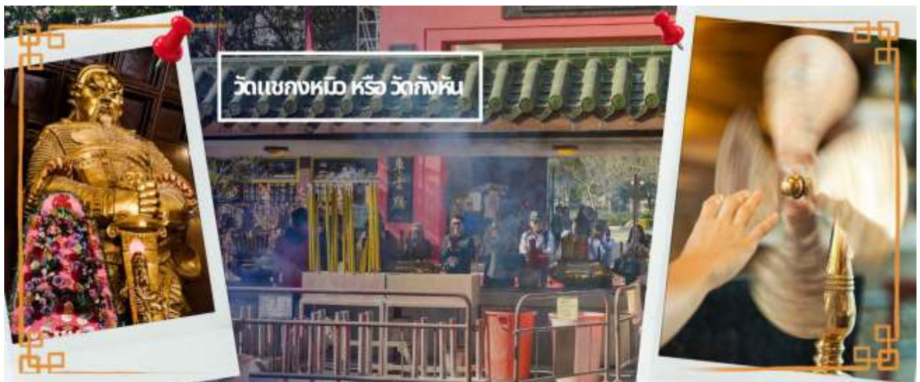
วัดแขกหมิว หรือ วัดกัณฑ์

จากนั้นนำท่านเดินทางไป วัดแขกหมิว หรือ วัดกัณฑ์ (CHE KUNG TEMPLE) วัดแขกสร้างขึ้นเพื่อเป็นอนุสรณ์เพื่อรำลึกถึงตำนานแห่งนักรบราชวงศ์ซ่ง มีนามว่า “แซ กง” แม่ทัพปราบศึก ผู้คนทั่วทุกดินแดนต่างยำเกรงในกำลังพลอันกล้าหาญแข็งแกร่งของแม่ทัพแซกง เป็นวัดเก่าแก่ที่มีความศักดิ์สิทธิ์มาก มีอายุกว่า 300 ปี ตั้งอยู่ในเขต SHATIN มีประวัติเล่าต่อกันมาว่า ขณะที่แม่ทัพปราบศึกอยู่นั้น ทุกแคว้นเขตแดนแผ่นดินใหญ่ต่างก็ยำเกรงต่อกำลังพลที่กล้าหาญในกองทัพของท่าน ยามที่ออกรบเพื่อดำเนินเข้าศึกศัตรูทุกทิศทาง ทุก ๆ ครั้งท่านใช้สัญลักษณ์รูปกัณฑ์ 4 ใบพัดติดไว้ด้านหลังรถศึกนำขบวนในกองทัพ เหล่าทหารกล้ามีความเชื่อว่าเมื่อพกพาสัญลักษณ์รูปกัณฑ์นี้ไป ณ ที่ใด ๆ กัณฑ์นี้จะช่วยเสริมสิริมงคล นำพาแต่ความโชคดี มีอำนาจเข้มแข็ง เสริมกำลังใจให้แก่กองทัพของท่าน ชื่อเสียงในการนำทัพสู้ศึกของท่านจึงเป็นตำนานมาจนทุกวันนี้ ปัจจุบันวัดแขกจึงเป็นสถานที่สักการะเคารพ ขอพร ท่านแซกง โดยมีสัญลักษณ์เป็นกัณฑ์นำโชคนั่นเอง ☯ การหมั้นกัณฑ์นำโชคที่ตั้งอยู่ในวัด เพื่อจะได้หมั้นเวียนชีวิตของเราและครอบครัวให้มีความเจริญก้าวหน้าด้านหน้าที่การงาน โชคลาภ ยศศักดิ์ และถ้าหากคนที่ดวงไม่ดีมีเคราะห์ร้ายก็ถือว่าเป็นการช่วยหมั้นบัดเป่าเอาสิ่งร้ายและไม่ดีออกไปให้หมด ในองค์กัณฑ์นำโชคมี 4 ใบพัด คือพร 4 ประการ ได้แก่ สุขภาพร่างกายแข็งแรง, เดินทางปลอดภัย, สมความปรารถนา และเงินทองไหลมาเทมา ในทุกๆวันที่ 2 ของเดือนแรกตามปฏิทินจีนชาวฮ่องกงและนักธุรกิจจะมาวัดนี้เพื่อถวายกัณฑ์ลมเพราะเชื่อว่ากัณฑ์จะช่วยพัดพาสิ่งชั่วร้ายและโรคร้ายใช้เจ็บออกไปจากตัวและนำพาแต่ความโชคดีเข้ามาแทน จากนั้นนำท่านเดินทางสู่ ย่านมงก๊ก เป็นย่านที่มีความคึกคักที่สุดแห่งหนึ่งในเกาะ