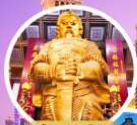
วัดเข่งหนิว