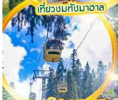
กระเช้า gondol 360 องศา