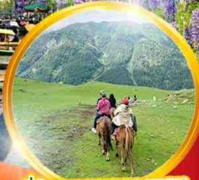
ขี่ม้าชมความงามของหุบเขา