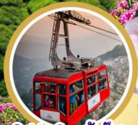
Cable Car กิ่งตอก