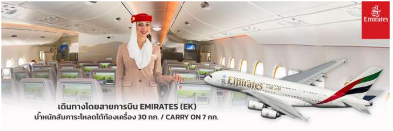
เดินทางโดยสายการบิน EMIRATES (EK) นำหนักสัมภาระโหลดใต้ท้องเครื่อง 30 กก. / CARRY ON 7 กก.