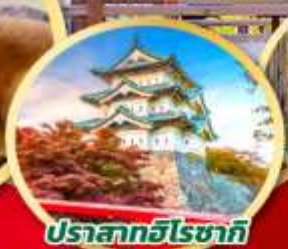
ปราสาทฮิโรซากิ