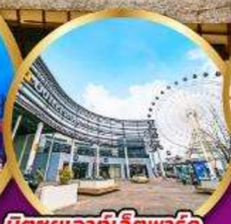
มิตซูเอาท่าเล็ดพาร์ค เซนได