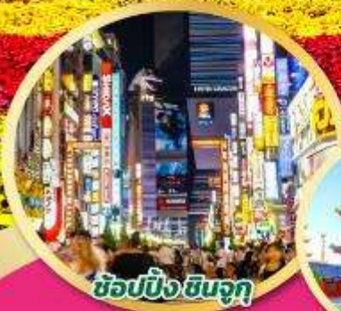
ช้อปปิ้ง ชิinjuku