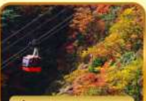
นั่งกระเช้าภูเขาโทโฮไซ