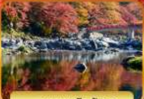
หุบเขาโคริงเค