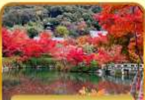
วัดเออิทังโด