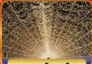
นาบะนะโนะซาโตะ