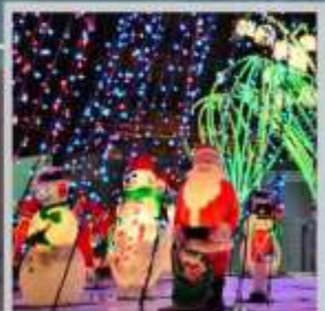
"ODORI GERMAN CHRISTMAS"