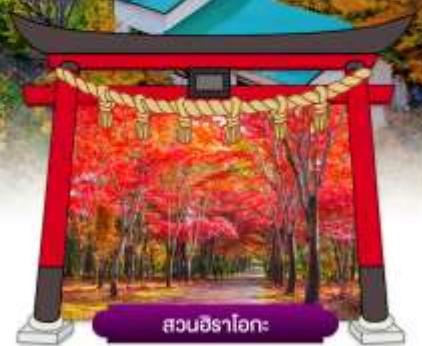
สวนฮิราโอะ