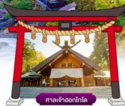
ศาลเจ้าออกโกโต