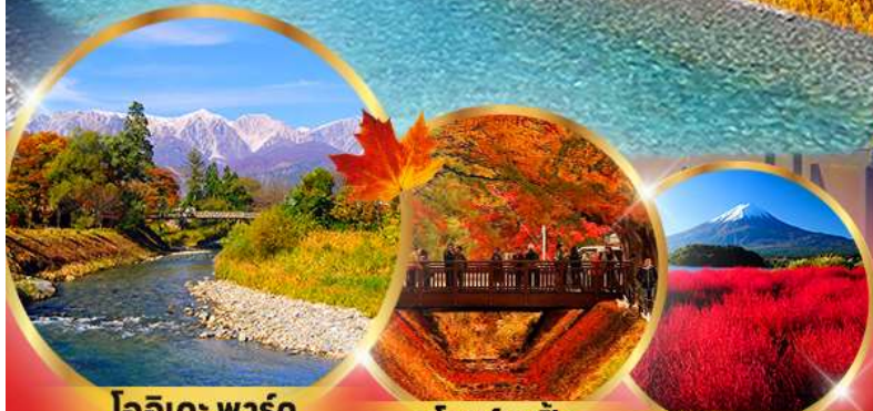
โออิตะ พาร์ค