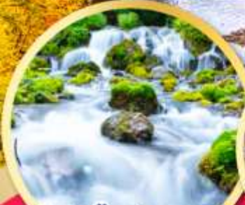
สัมผัสน้ำแร่ธรรมชาติ ณ สวนพุทิตาชิ