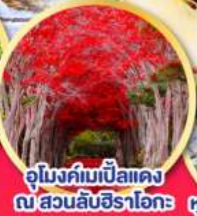
อุโมงค์ไม้แป้นแดง ณ สวนลับชิราโอกะ