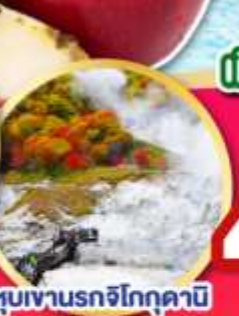
หุบเขารอกจิกอกุคาบิ