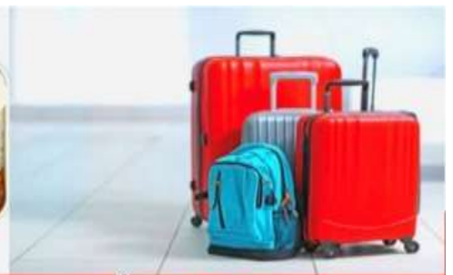
น้ำหนักกระเป๋า สูงสุด 20 กก.

08:40 ถึง สนามบินคันไซ ประเทศญี่ปุ่นดินแดนอาทิตย์อุทัย หลังผ่านพิธีศุลกากรและตรวจคนเข้าเมืองพร้อมรับสัมภาระเรียบร้อยแล้ว