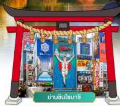
ย่านชินโซบาสึ