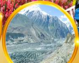
นั่งรถจี๊ป ชมกราเซีย สัมผัสวิวสุดมหัศจรรย์