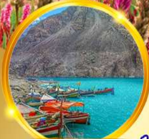
ล่องเรือชมทะเลสาบอิตตาบัด

อิสลามาบัด นاران หุบเขาอุนซ่า พาสสุ ด้านคุนจิราบ คิลกิต ดักดิลาก