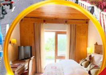
พักโรงแรมดี 4-5 ดาว มาตรฐานท้องถิ่น