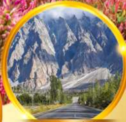
ยอดเขาสูงสุดยิ่งใหญ่แห่งพาสสุ