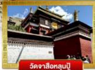
วัดจาซือหลุนปู้