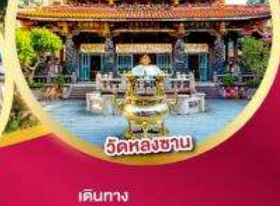
วัดหลงชาน