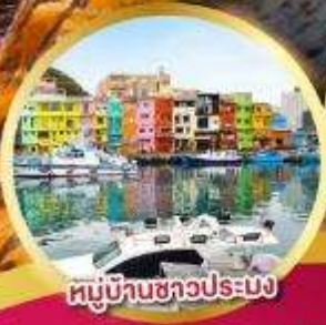
หมู่บ้านชาวประมง