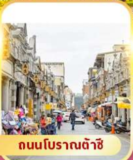
ถนนโบราณต้าซี