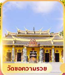
วัดขอความรอย