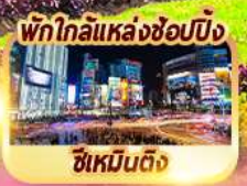
พักใกล้แหล่งช้อปปิ้ง ซีเหมินติง