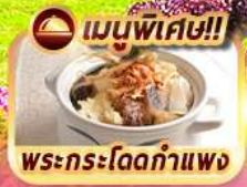
เมนูพิเศษ!! พระกระโดดกำแพง