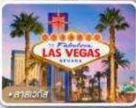
ลาสเวกัส