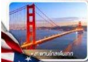
สะพานโกลเด้นเกต

★ เยือนอุทยานเกรนด์แคนยอน ฝั่ง South rim ความมหัศจรรย์ทางธรรมชาติ ที่ยิ่งใหญ่ที่สุดแห่งหนึ่งของโลก