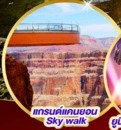
แกรนด์แคนยอน Sky walk