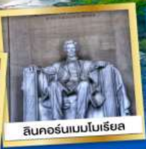
ลินคอล์นเนบไบเรีย