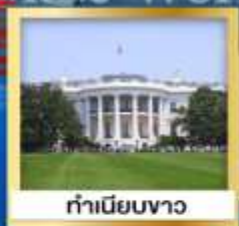
ทำเนียบขาว