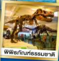
พิพิธภัณฑ์ธรรมชาติ