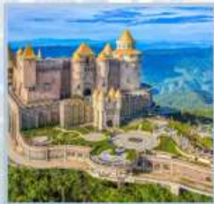
ปราสาทจันทร