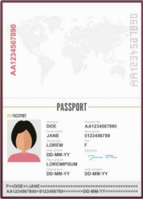
รูปถ่ายหน้าพาสปอร์ต